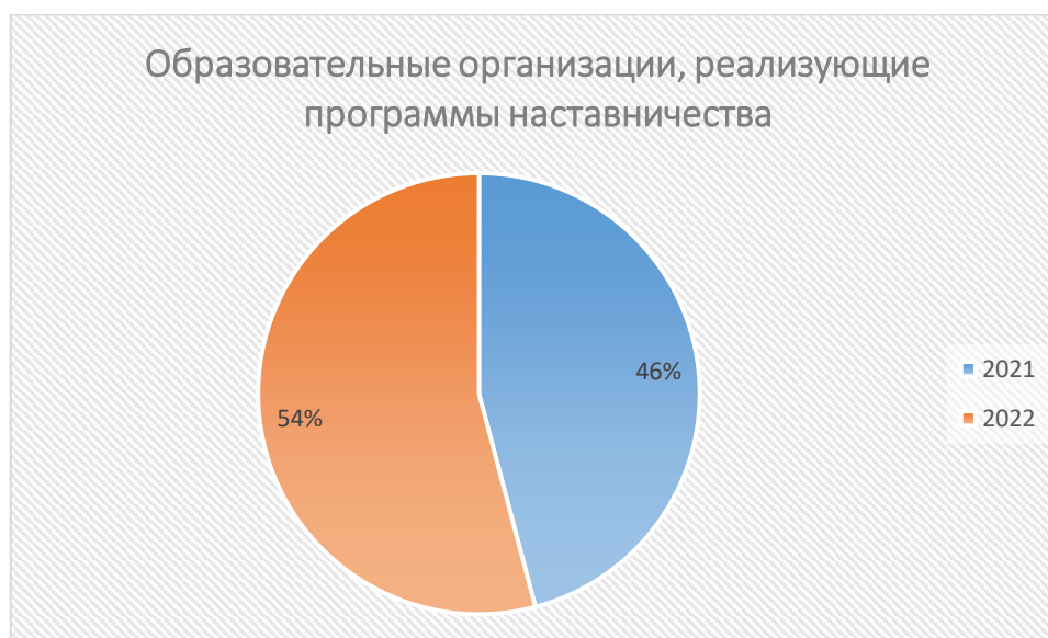
Рисунок 5. ОО, реализующие программы наставничества